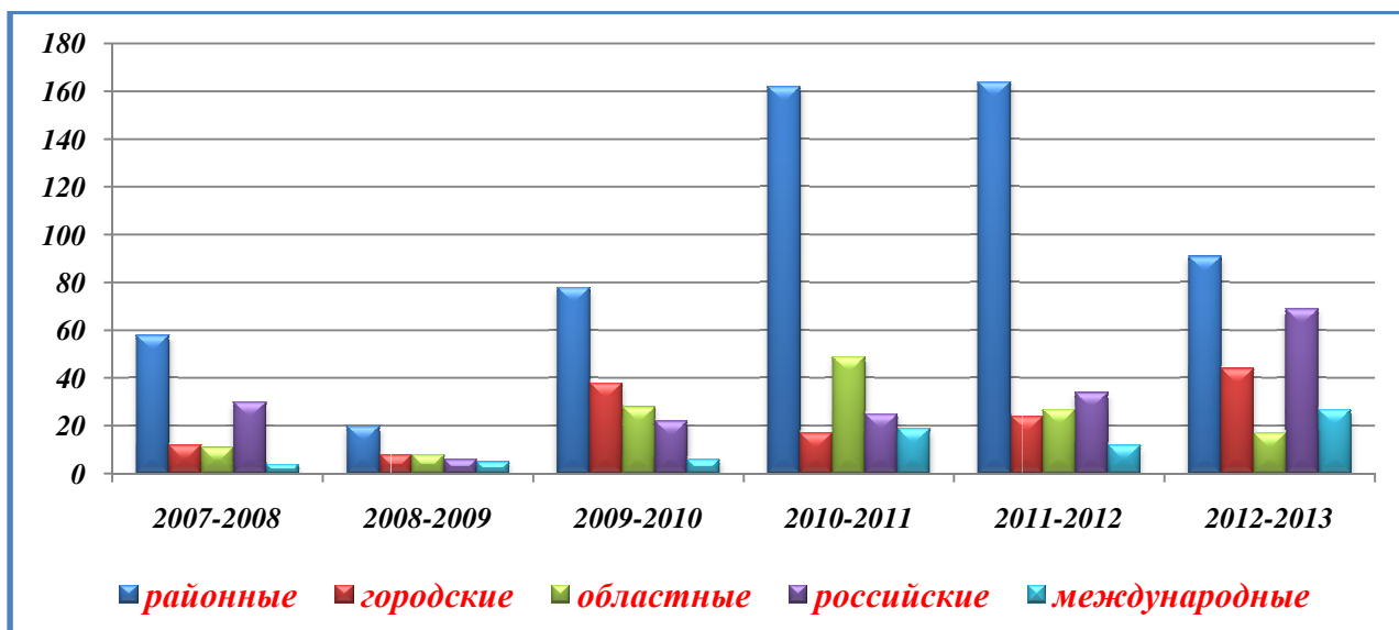
Диаграмма 9. Результативность участия обучающихся лица в творческих конкурсах за шесть лет.

Следует отметить, что достаточно высокой результативности в мероприятиях различного уровня способствовало: