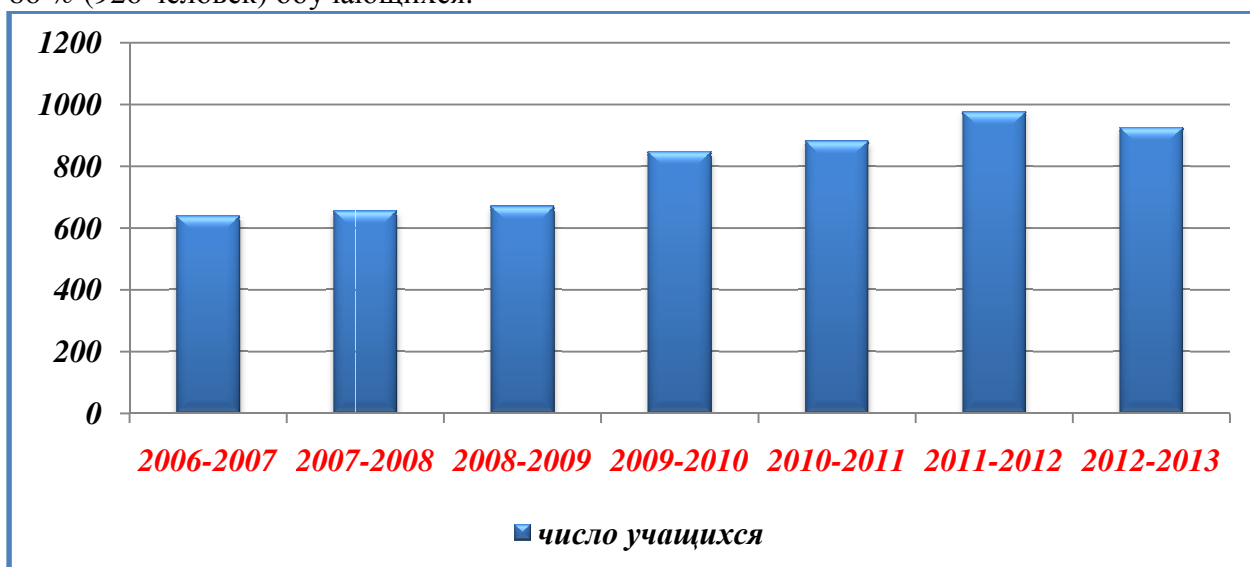
Диаграмма 5. Охват обучающихся лицея дополнительным образованием лицея и учреждений города за четыре года.

В учреждениях дополнительного образования лицея и города Волгограда занимается 86 % (926 человек) обучающихся.