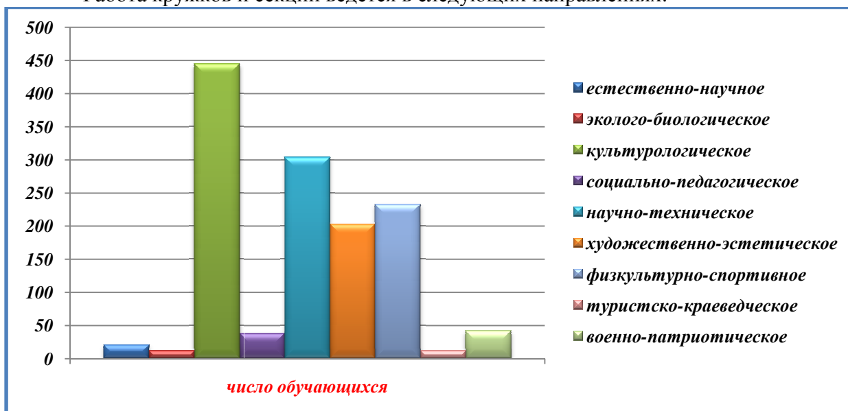
Диаграмма 7. Количество лицеистов, занимающихся в кружках и секциях лицея.

Работа кружков и секций ведется в следующих направлениях: